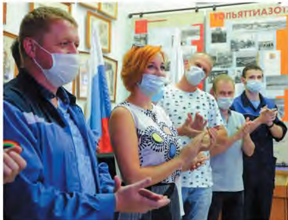
Спорт – это хорошее настроение

Желаем всем тоазовцам, неравнодушным к спорту и здоровому образу жизни, добиваться больших побед, достигать рекордных результатов и найти свою команду мечты.