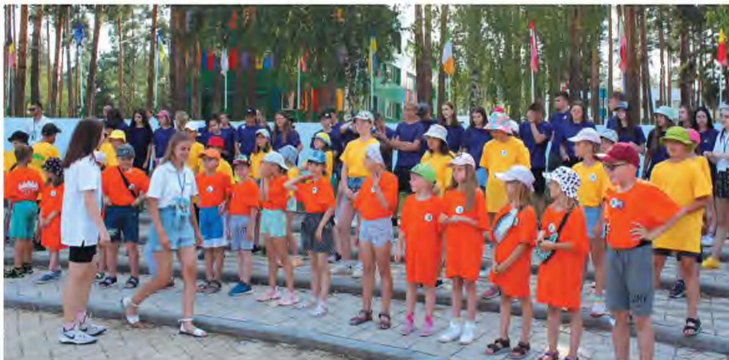
Оздоровительный центр «Циолковский» – территория детского счастья