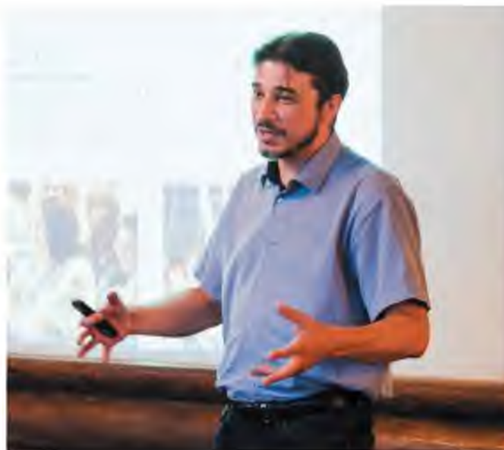
Второй год подряд грант получает проект «Премьера одной репетиции»

Пятый этап «Химии добра» не за горами. Прием заявок начнется 1 сентября и продлится до 30 ноября. Подробности – на официальном сайте Тольяттиазота ( www.toaz.ru ), в разделе «Химия добра».