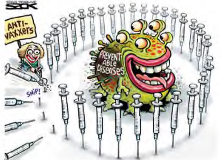
Антипрививочник и болезнь, которую можно остановить вакцинацией

В последнее время много вакцинированных людей стали заражаться коронавирусной инфекцией. У многих она часто протекает бессимптомно, как раз благодаря иммунной защите, полученной с помощью прививки. Но вот непривитого человека