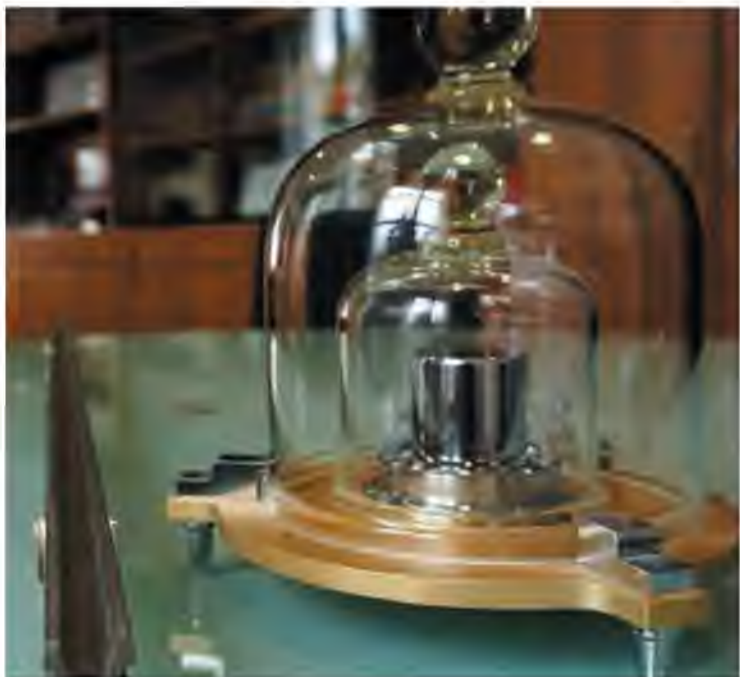
Из платины изготовлены эталоны метра и килограмма, хранящиеся в международном бюро мер и весов во Франции