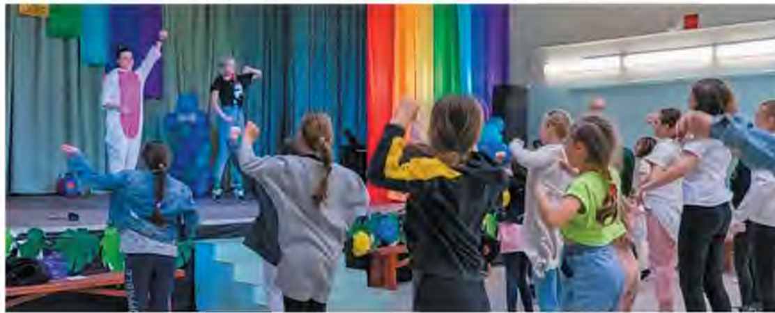
Дружить, играть и развиваться веселее вместе

Одно из запоминающихся событий – военно-патриотиче-