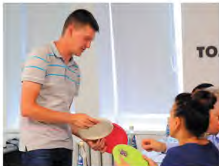
В Комсомольском районе появится парк для дискогольфа